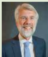
Onderzoeker: prof. dr. E.J.A. Scherder

Onderzoek: De genetische factoren die parkinson veroorzaken identificeren.