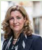
Onderzoeker: prof. dr. E. Aronica

Onderzoek: Onderzoek naar de rol van de insula bij cognitieve symptomen in een vroeg stadium van parkinson.