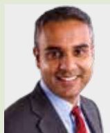
Onderzoeker: dr. K. Ikram

Onderzoek: Onderzoek naar effectieve pijnbehandeling die de levenskwaliteit van parkinsonpatiënten verhoogt.