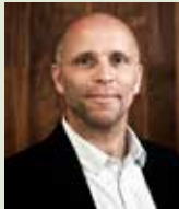
Onderzoeker: dr. W. Mandemakers

ParkinsonFonds is de belangrijkste financier van wetenschappelijk onderzoek. Hieronder vindt u zes onderzoeken die dankzij bijdragen van onze donateurs kortgeleden zijn gestart.