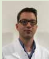
Onderzoeker: dr. J. de Jong

Onderzoek: Onderzoek naar de rol van het SYNJ1-eiwit in de hersenen van parkinsonpatiënten.