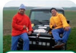
7 Team Buurman en Buurman reist naar de Noordkaap