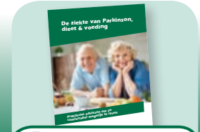
8 Brochure over voeding & dieet